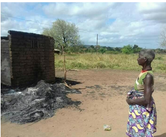
Imagem: Residência de simpatizante em Inhangoma

O simpatizante da Renamo acusa seus homólogos da Frelimo de estarem por detrás do incidente por não ter aceite se juntar àquele partido.